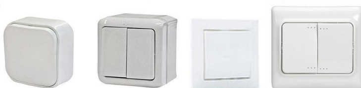
Одноклавишный выключатель открытой установки Двухклавишный выключатель открытой установки (сдвоенный) Одноклавишный выключатель скрытой установки Двухклавишный выключатель скрытой установки (сдвоенный)